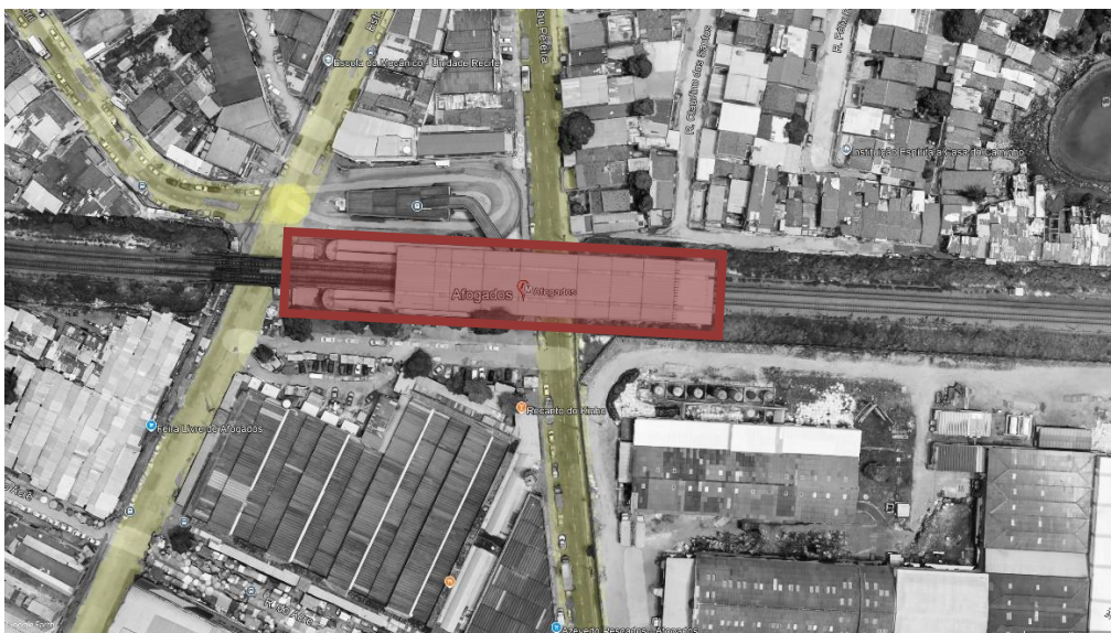
FIGURA 1 – ESTAÇÃO AFOGADOS